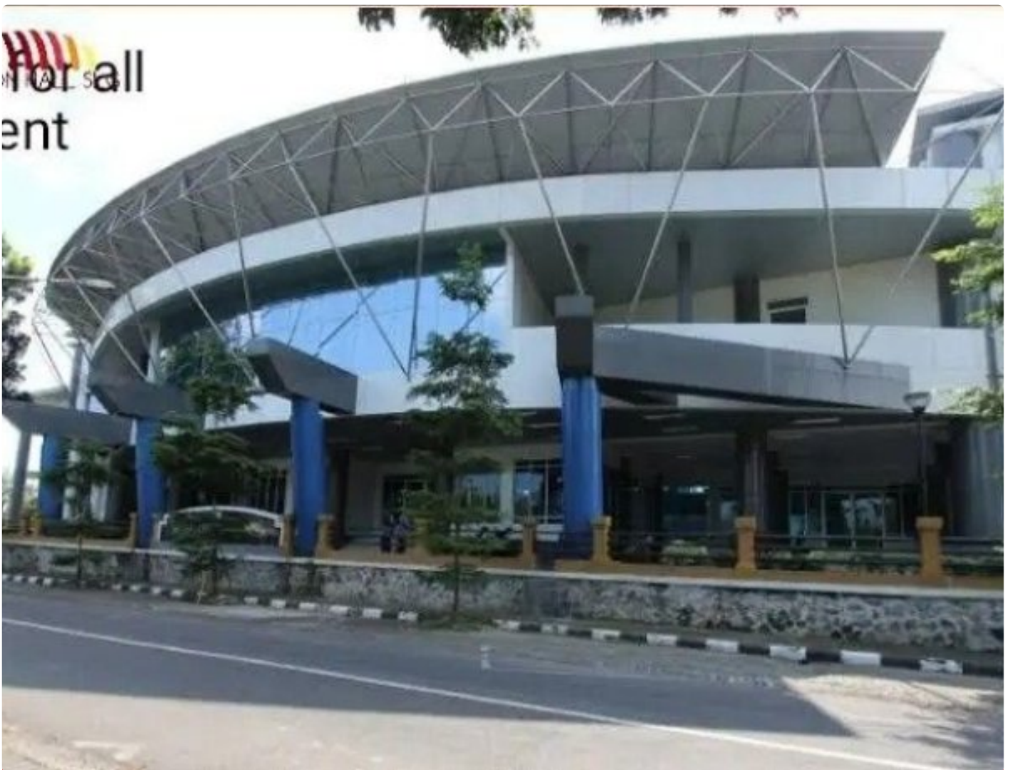
Gedung Convention Hall Simbang Lima Gumul Kabupaten Kediri.

Kediri - Sebuah bangunan gedung serbaguna yang menjadi pusat perhatian masyarakat Jawa Timur terletak di kawasan Kabupaten Kediri yang strategis, yakni Gedung Convention Hall di wilayah Simbang Lima Gumul (SLG), bangunan ini tidak hanya menawarkan desain arsitektur yang megah, tetapi juga